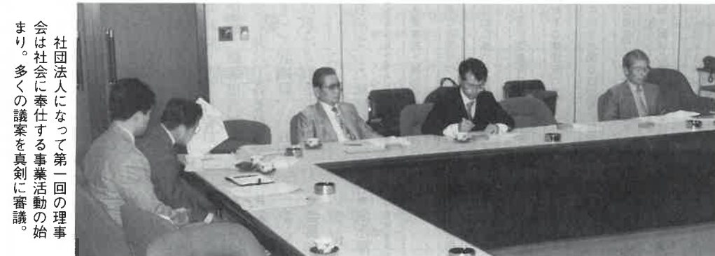
社団法人になって第一回の理事会は社会に奉仕する事業活動の始まり。多くの議案を真剣に審議。