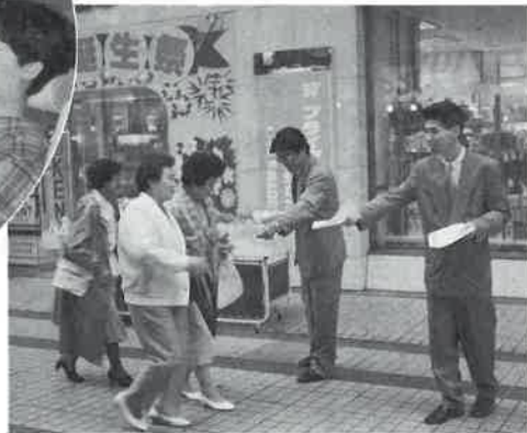
日程は6月13日岩見沢/18日旭川/19日札幌・釧路・帯広・浦河・函館/21日北見/27日室蘭/7月2日留萌/20日広尾