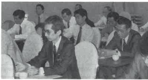
関西協会の勉強会

ないということですが、具体的には法人の役員や会員に、あるいは寄付者などに、利益を分配したり、財産を還元したりしないという意味です。これに関連して、日本サウナ協会の定款第48条(残余財産の処分)には「この法人の解散のときに有する残余財産は、総会において正会員数の4分の3以上の議決を経、かつ厚生大臣の許可を得て、この法人と類似の目的を有する団体に寄付するものとする」と規定されています。解散することは、ほとんどありませんが、このように利益の分配も財産の還元もされないといい